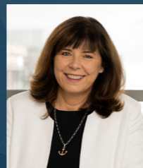
Jutta Steinruck Oberbürgermeisterin der Stadt Ludwigshafen am Rhein